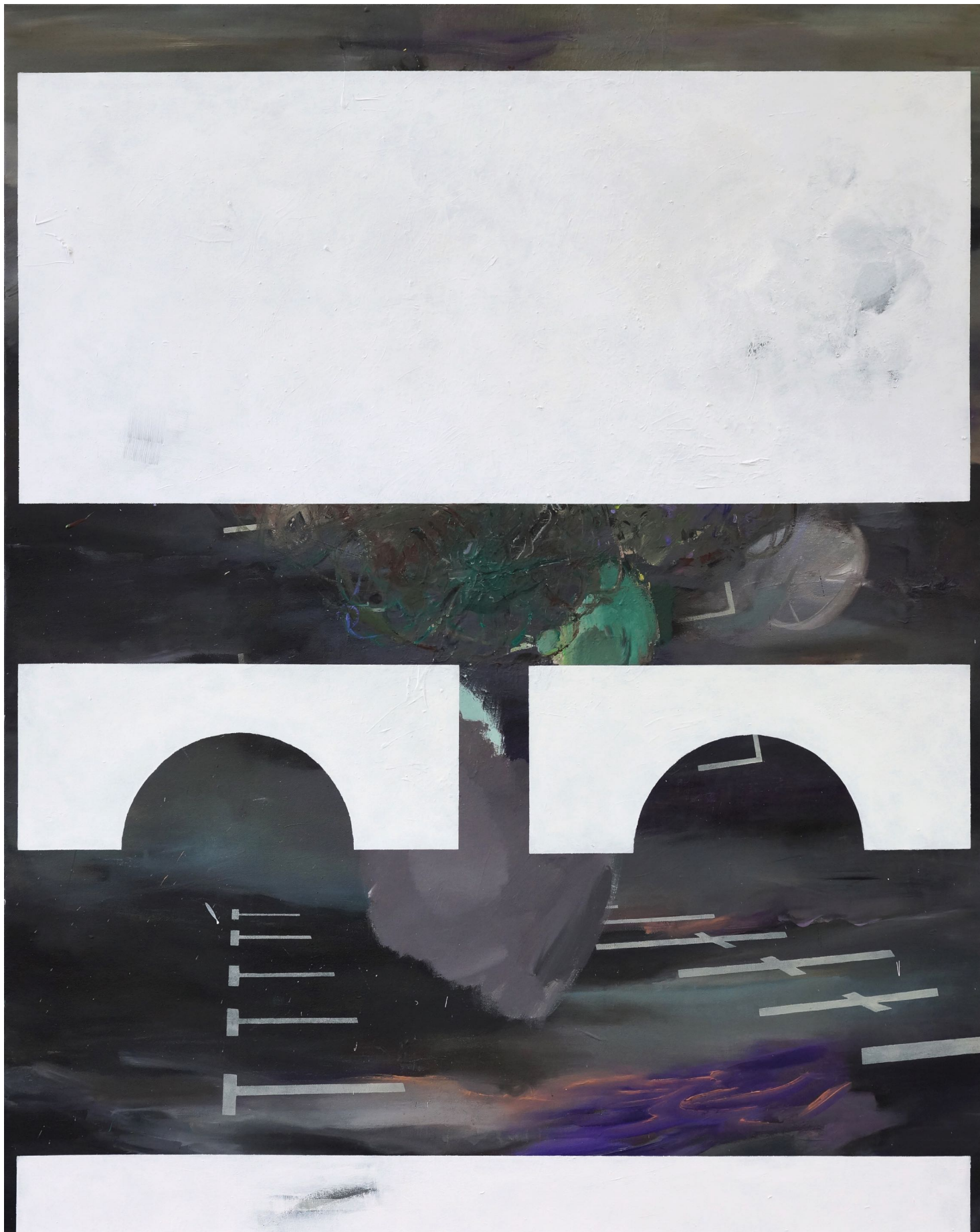
MARTIN MOHR time warp

Acryl, Lack und Öl auf Leinwand 150 x 140 cm 2016