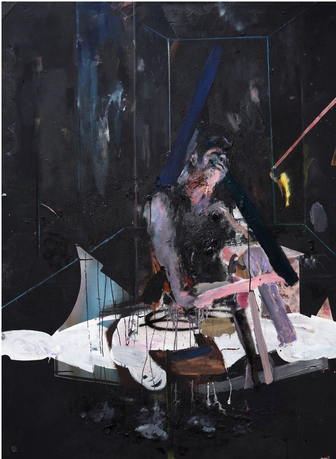
MARTIN MOHR Sonnenkönig

Acryl, Lack und Öl auf Baumwolle 150 x 110 cm 2013