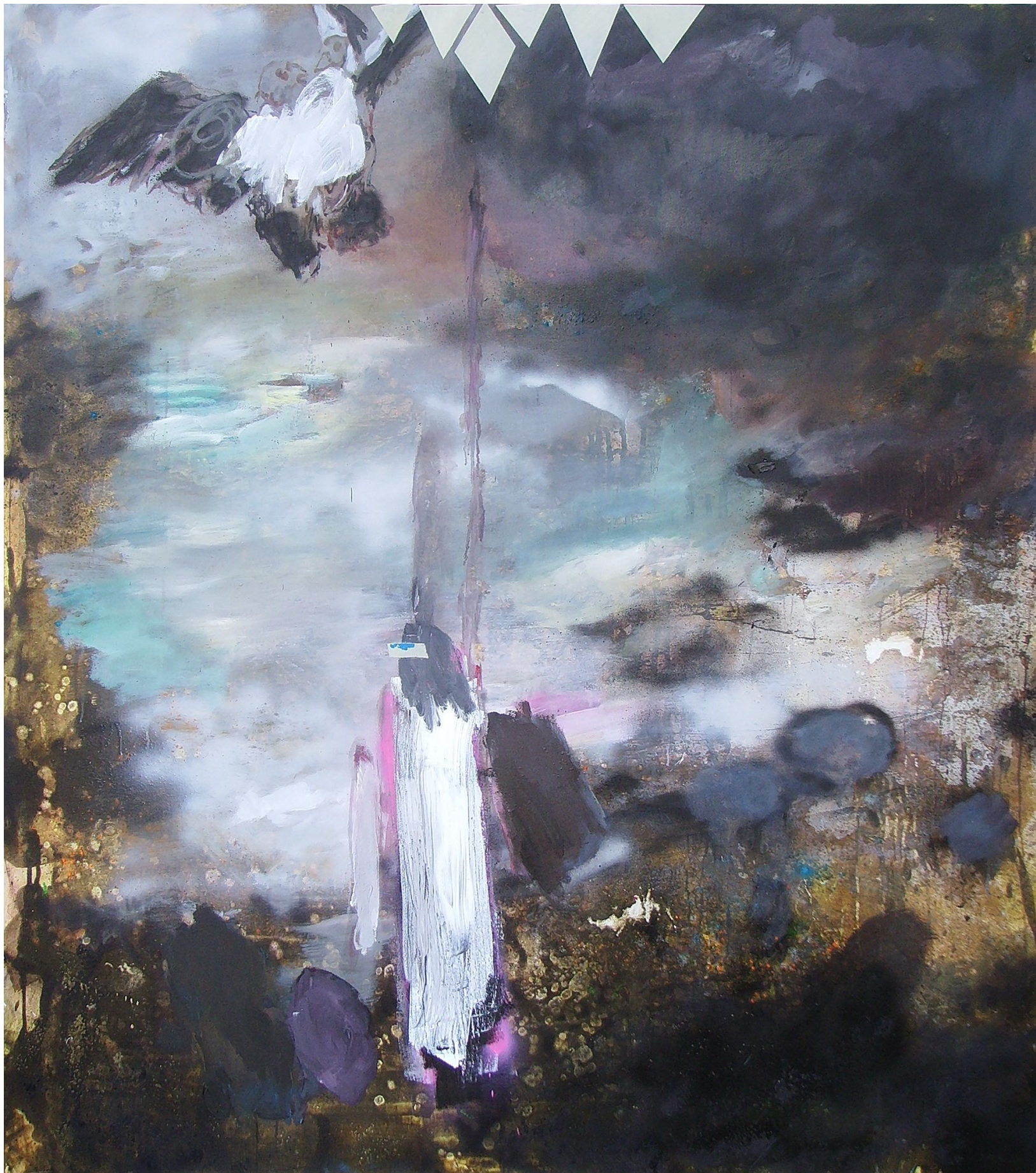
MARTIN MOHR Mönch am Meer

Acryl, Lack und Öl auf Baumwolle 170 x 150 cm 2011