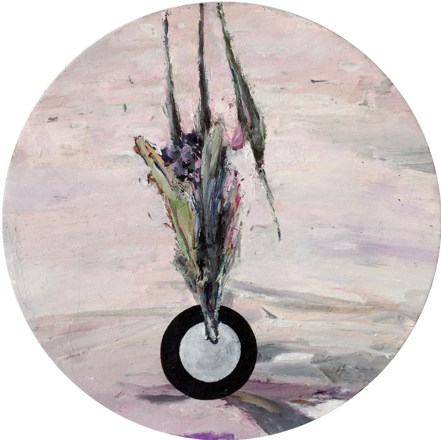
MARTIN MOHR Auf der Jagd

Acryl, Lack und Öl auf Baumwolle D=30 cm 2012