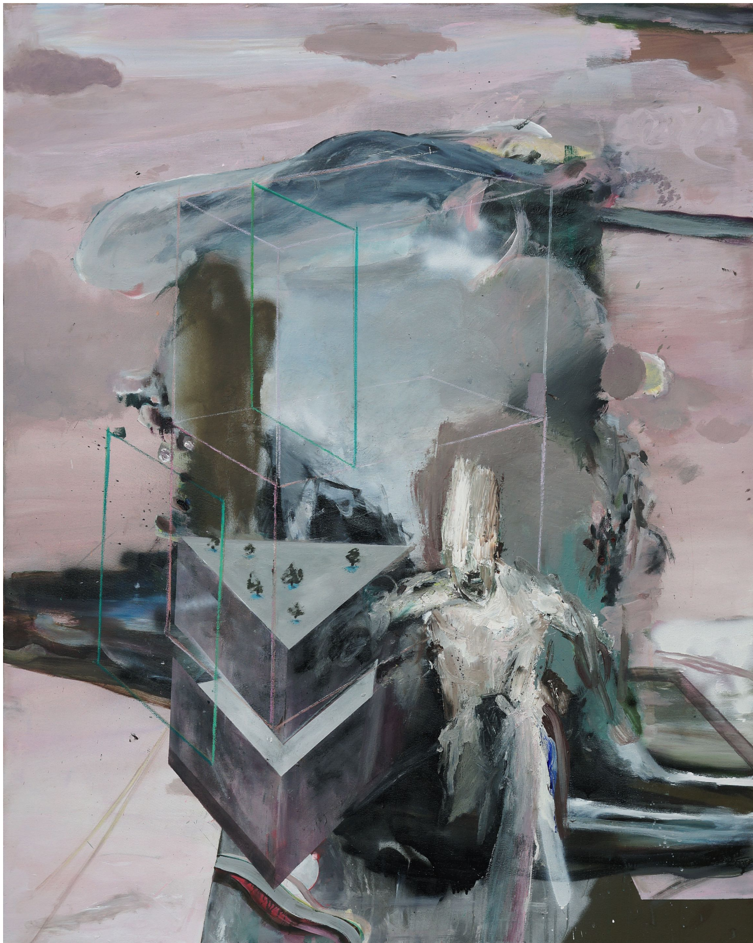
MARTIN MOHR Der Alleswoller

Acryl, Lack und Öl auf Baumwolle 150 x 120 cm 2013