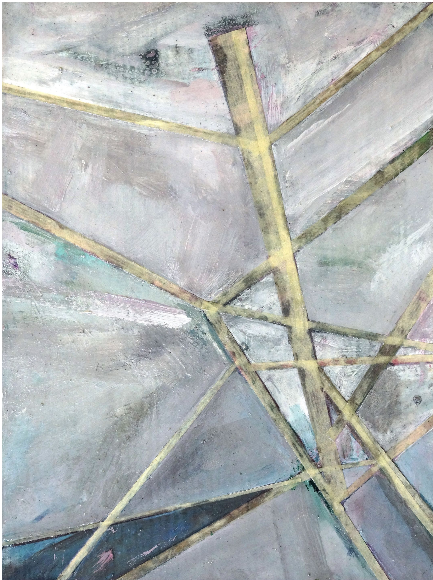
MARTIN MOHR Zyklus Wallfahrt #102