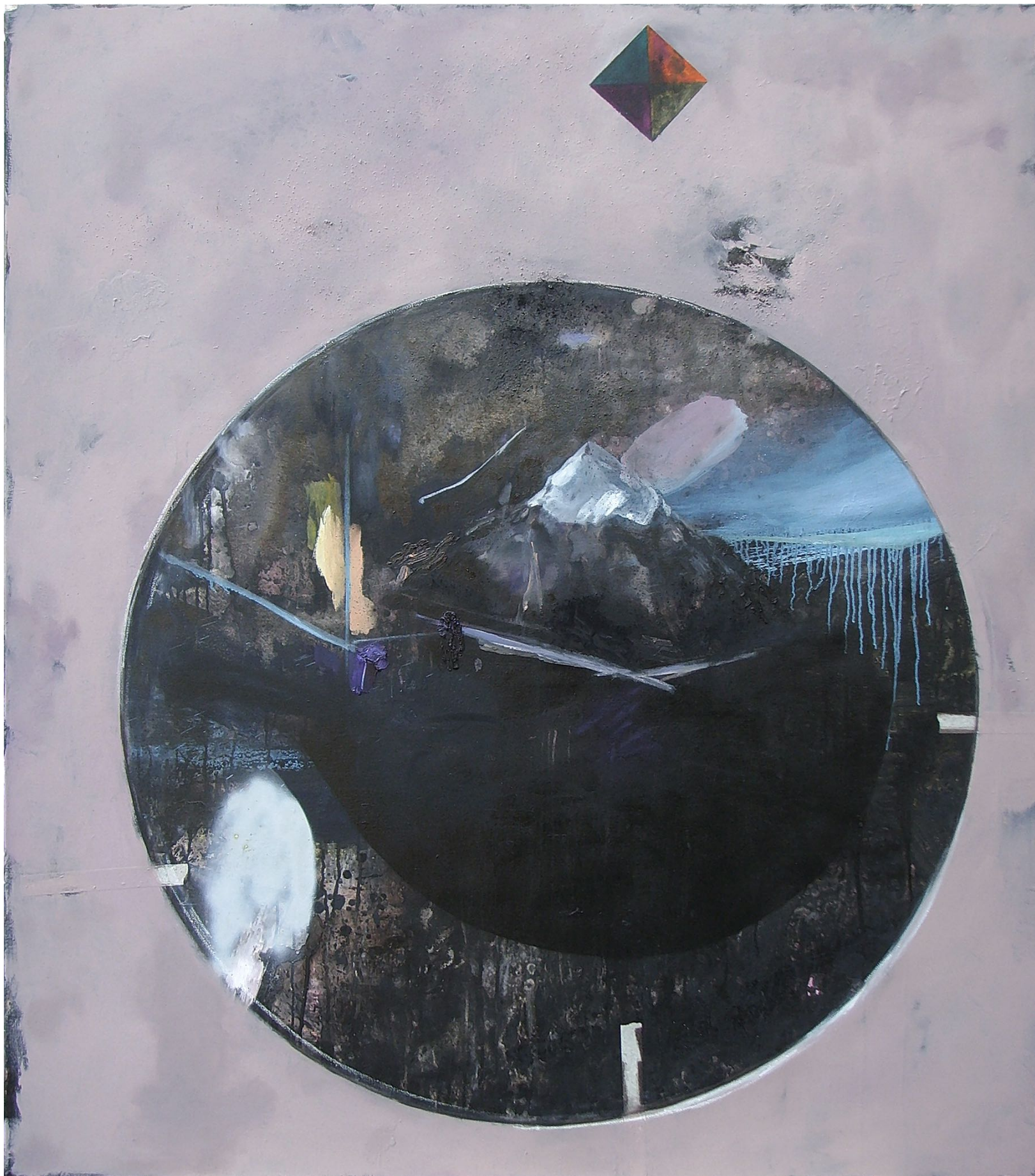
MARTIN MOHR Berg Aratat 2.0

Acryl, Lack und Öl auf Baumwolle 170 x 150 cm 2011