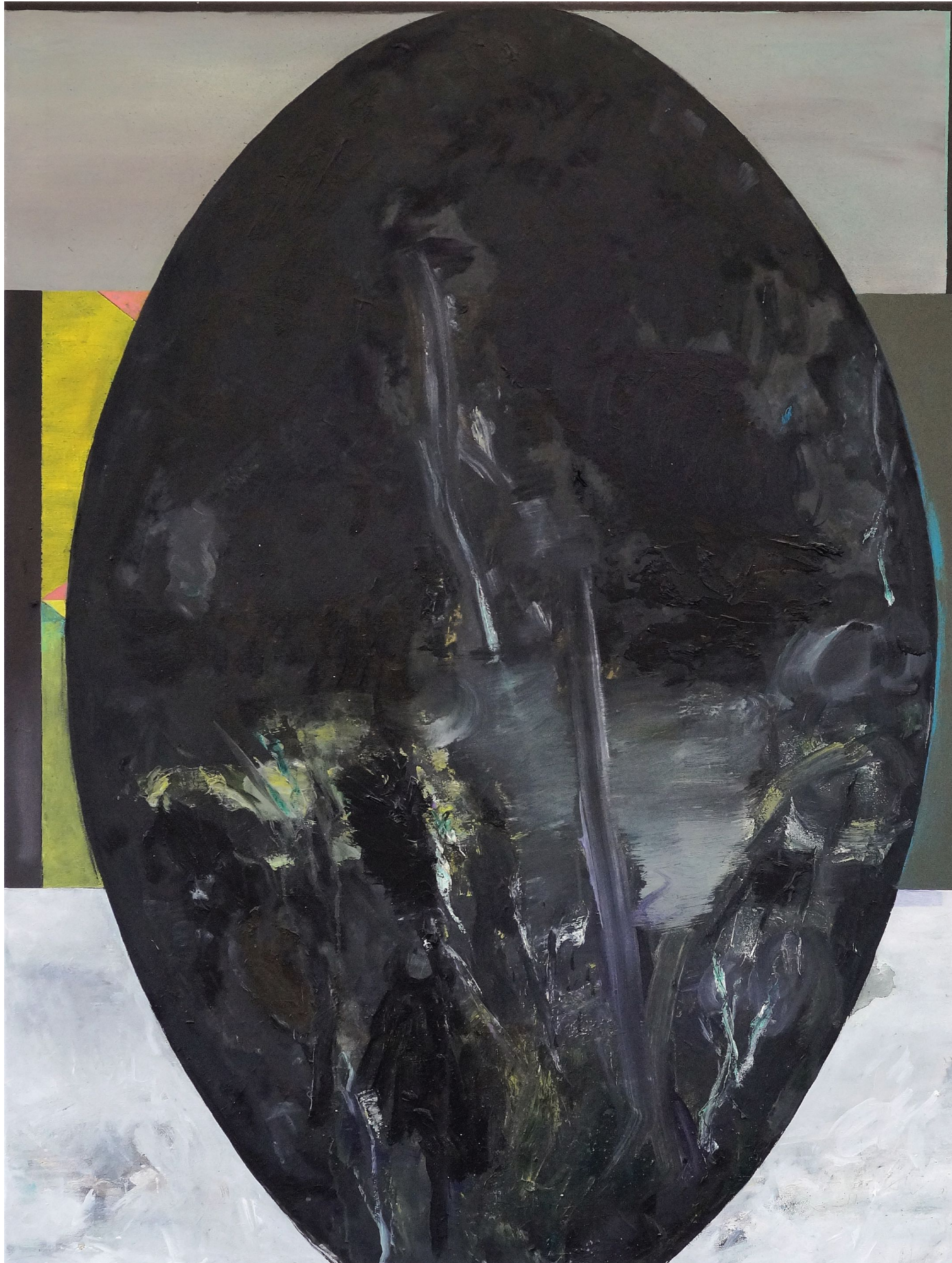
MARTIN MOHR Wolkenkuckucksei

Acryl, Lack und Öl auf Baumwolle 120 x 90 cm 2014