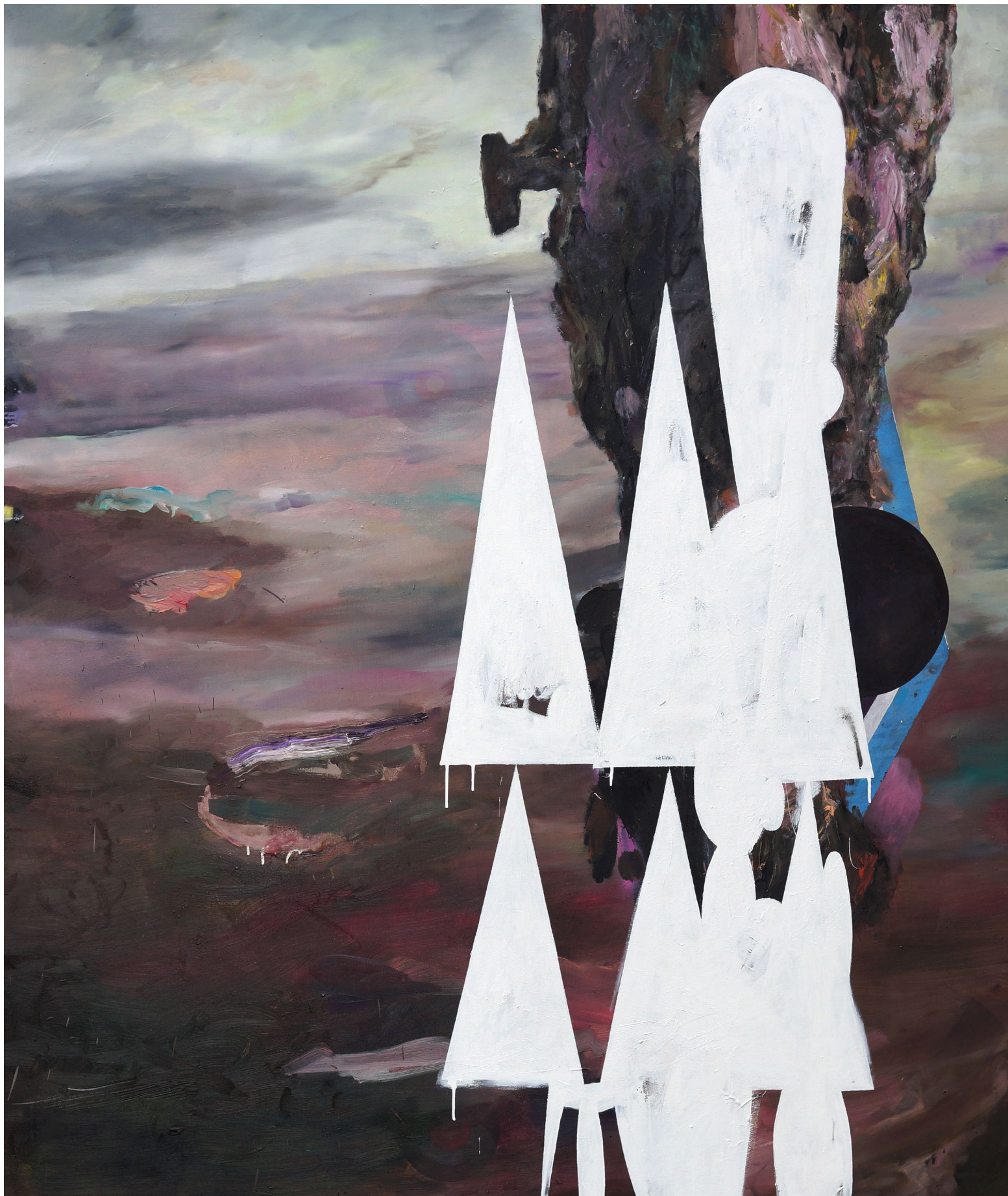
MARTIN MOHR Bohmisches Dorf

Acryl, Lack und Öl auf Baumwolle 200 x 170 cm 2012