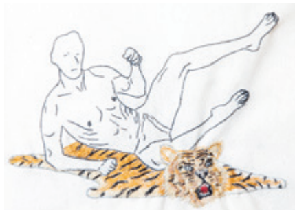
GÖKÇEN DILEK ACAY gym on tiger Stickerei / 30x40cm / 2018

The ego is subject to a multitude of concepts and ideas - be it in modern philosophy, analytical psychology or sociology. All these perspectives, however, share the same insight: the ego can only be understood in relation to its environment. Ego is