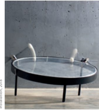
THE DATA DRIVEN OBJECTS PROJECT Trommel Installation, 2018

juxtaposed with Eco. A term that describes the relationships between all living beings and their environment. Ego vs. Eco thus examines the interplay between the human individual and the environment.